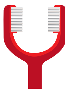
Cepillo Dos Cabezales